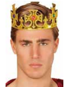
Publikumspreis: Die goldene Krone

Musikalisches – am Sonnabend mit dem Duo CharisMa sowie Rico Borven , am Sonntag 12 Uhr: BAAST! und zum guten Schluß die Soulmaids .