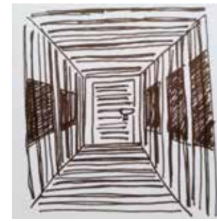
Strich.Code René Scheer

Poetry Slam, Audio, Video: Zum ersten Mal sind sie dabei: Die Schreibgesellschaft bringt ihre machtvolle Texte in hoher Höhe zum Vortrag sowie auch zum Lesen – Die Phönixklasse dagegen bespielt Räume mit Installationen und Filmen.