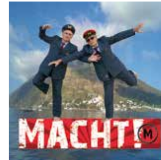
Ein Kleines Loch auf der Macht I Santini Del Prete