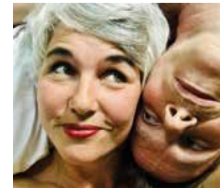
Kinderglück Engelbach & Weinand