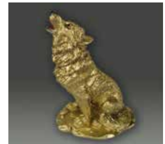
Publikumspreis: Der goldene Wolf

„Der goldene Wolf“, Publikumspreis 2022, gestiftet vom Förderverein KOTTWITZKeller e.V. Die Preisverleihung findet am Sonntag um 16.00 Uhr statt.