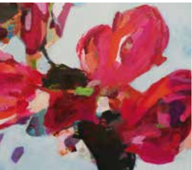
Abstrahierte Blüten Hanna Knirsch

Zen-TV, eine interaktive Meditations-Installation (nicht zu verwechseln mit dem ZDF) verbindet die digitale mit der analogen Welt. Tankred Tabbert verspricht intensive, mitunter ultimative, lang anhaltende Glücksmomente.