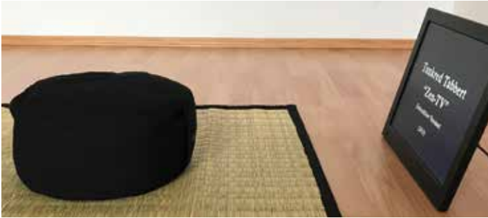
Zen-TV(seit 2013) Tankred Tabbert