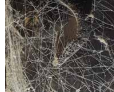
Unglücklicher Eindringling Jana Plogharová